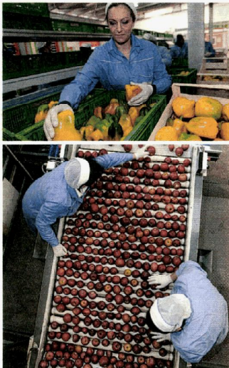
LA LAVORAZIONE DELLE MELE ANNURCHE E DEI PEPERONI ALLA COOPERATIVA SOLE DI PIANURA. NELLA TERRA DEI CASALESI NON È STATO SEMPLICE FARE IMPRESA: NEL 2006 LO STABILIMENTO FU INCENDIATO, MA RIAPRI DOPO SOLI VENTI GIORNI

Secondo la Flai Cgil sono ancora 400 mila i lavoratori sfruttati dal caporalato: per l'80 per cento stranieri, faticano 12 ore nei campi per 25-30 euro a giornata, meno di 2,50 euro l'ora. E per Eurispes e Coldiretti il business delle agromafie ha superato i 16 miliardi di euro nel 2015. Anni fa fece scalpore Io schiavo in Puglia , l'inchiesta dell'inviato dell' Espresso Fa-